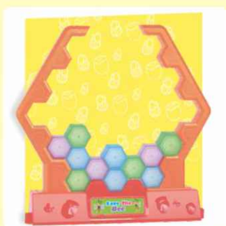
2. Pomoću blokova sastavite košnicu meda.