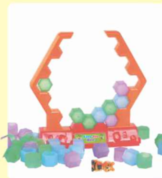
6. Ako pčela padne iz košnice igra završava.