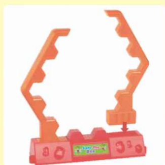
1. Postavljanje okvira.

Upotrijebite blokove 'meda' da sagradite košnicu. Odvojite karton i započnite igru. Svaki igrač započne potez tako da zavrti kolo i zatim izbije jedan blok meda boje koju pokazuje strelica na kolu. Igrač koji sruši pčelu gubi igru.