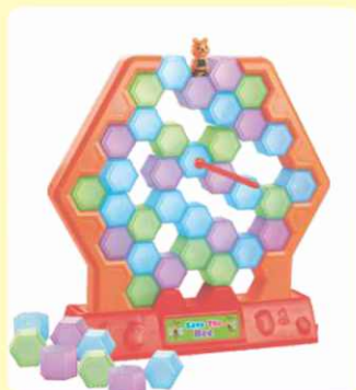
5. Izbijte blok boje koja je prikazana na kolu.